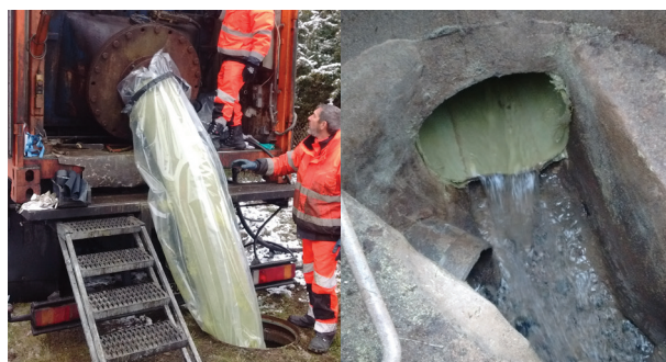
Travaux de gainage