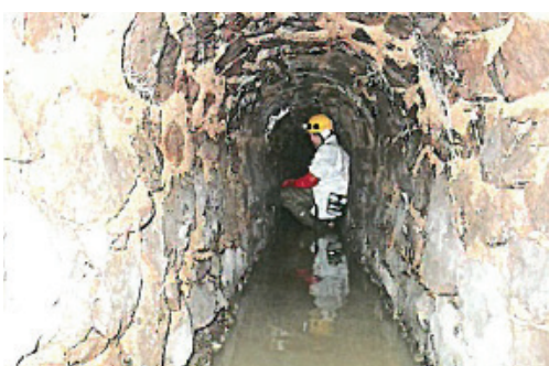
Etat actuel du réseau visitable