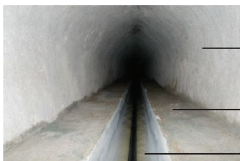
Aperçu du rendu final après travaux